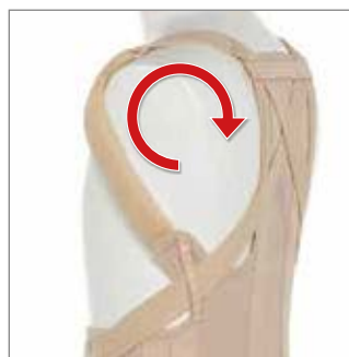
TRAZIONE ANTERO POSTERIORE DEGLI SPALLACCI

ALTEZZE retro cm 50 e davanti cm 18. TESSUTI Tessuti cotone elasticizzato Gardenia retro. Tiranti di rinforzo regolabili in tessuto Microgrip. Bretelle imbottite. STECCATURA due 2008 retro e quattro 1304 al fianco, tutte ricoperte con strisce di gallone rigido. CHIUSURA velcro. DISPONIBILI IPERTEX ® /52 ● nudo. IPERTEX ® /58 con altezza retro cm 58 e davanti cm 22 ● nudo. SU RICHIESTA IPERTEX ® /52 in tulle traforato ● grigio. IPERTEX ® /52 in tulle traforato ● nero.