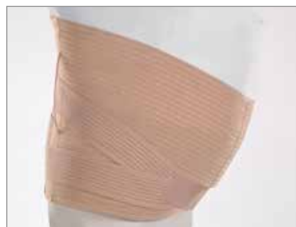
DOPPIA FASCIA SPECIALE

ALTEZZE retro cm 50 e davanti regolabile da cm 22 a cm 27 TESSUTI cotone elasticizzato Gardenia retro. Doppia fascia anteriore in Microgrip davanti. Bretelle in morbido tessuto Microgrip. STECCATURA due 2008 cm 42 paravertebrali estraibili affiancate da due 1505 cm 34 estraibili e due 1304 cm 24 al fianco tutte ricoperte con strisce di gallone rigido. CHIUSURA velcro. COLORE ● nudo. AGGIUNTIVO predisposto per il Supporto Lombare.